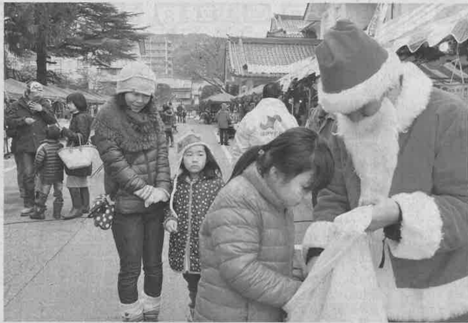
サンタクロースも登場。子どもたちに袋の中からプレゼントを手渡した

諏訪市の諏訪湖畔をイルミネーションで飾る「諏訪を彩る光の祭典」のオープニングイベントとして、21、22の両日、同市湖岸通り4の片倉館駐車場で「クリスマス・マルクト（マーケット）」を開いている。10周年記念の今年はクリスマスツリーなどの装飾を拡充。露天市場は飲食系が10店舗、クラフト系が20店舗の過去最高となる計30店舗が出店した。初日は家族連れらでにぎわった。